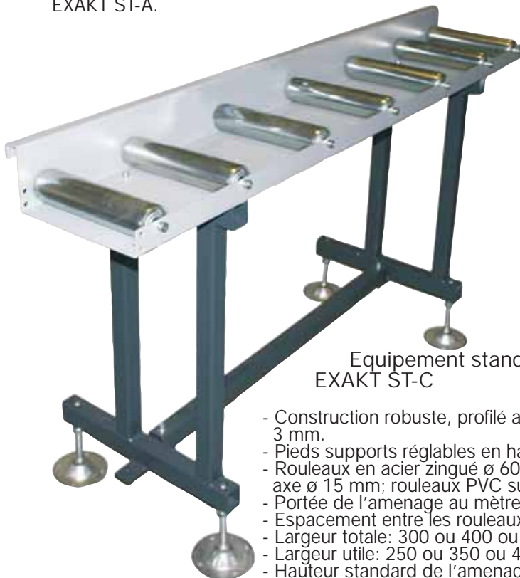
Equipement standard EXAKT ST-C