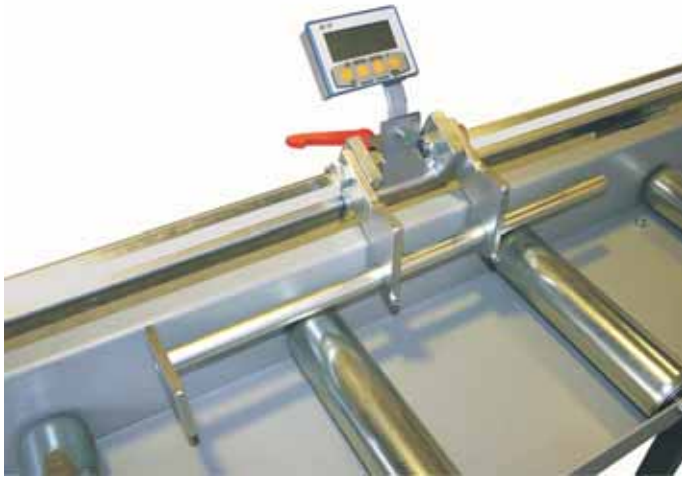
Equipement standard EXAKT ST-E